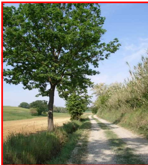
Un tratto del percorso

Il Servizio Parchi individua i sentieri più significativi degli 8 settori al fine di promuovere forme di turismo a basso impatto ambientale e una migliore conoscenza del nostro territorio.