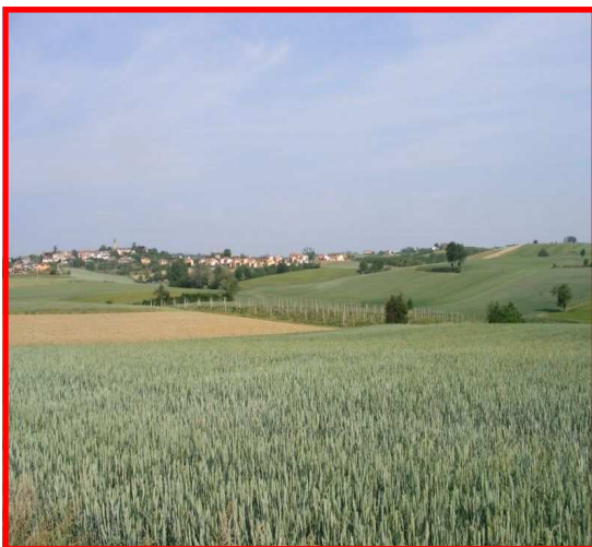
Veduta di Terruggia

Autostrade A26 Voltri-Sempione Uscita Casale sud Ex SS 31 direzione Alessandria, SP 44 direzione Terruggia Parcheggio presso la piazza del Municipio